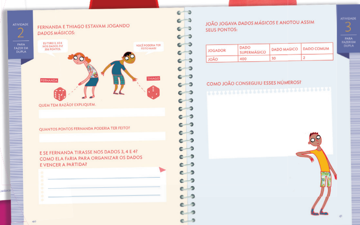
Livro do Aluno