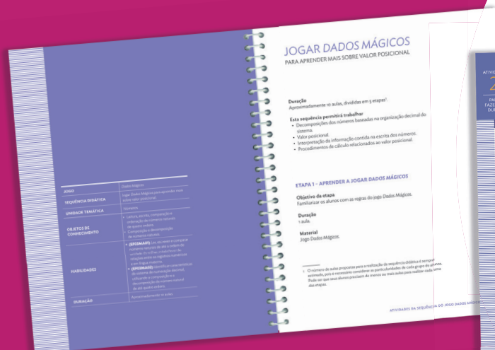
Livro do Professor